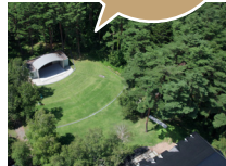
アルゾア女神の森 美ウェルネスガーデン